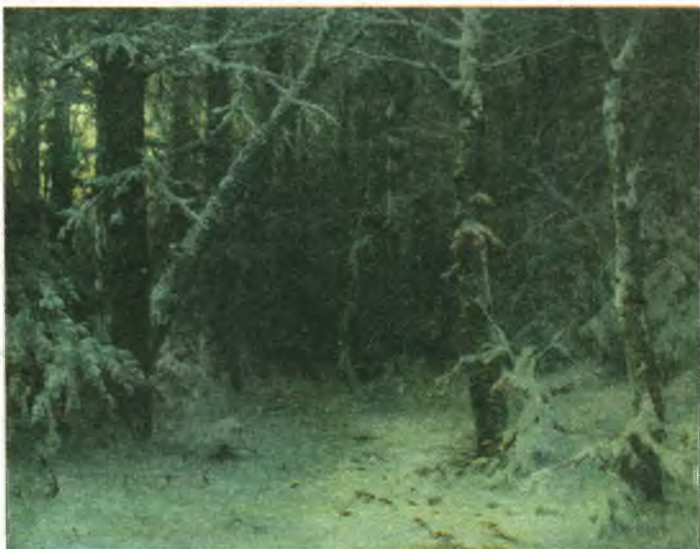
Іван Шишкін. Зимовий ліс